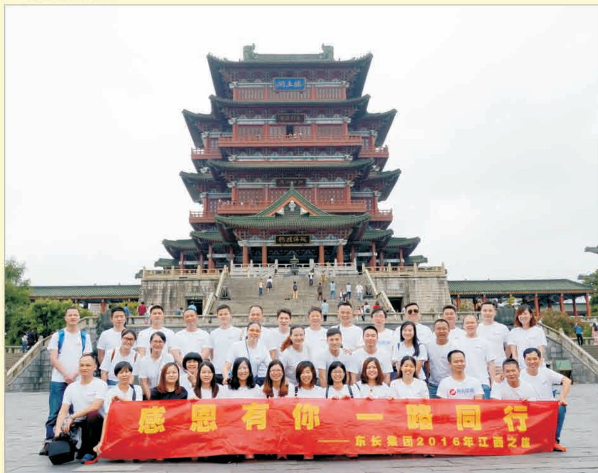
▼ 滕王阁景区大合影

活动中参观游玩了南昌的八一起义纪念馆、滕王阁及庐山的锦绣谷、美庐、花径、三宝树等著名景点。庐山就像一本厚厚的、博大精深的书，细细品读方能读到他的底蕴。虽然此次行程匆匆及走马观花般的游玩可能会错过许多的精彩，但正因为如此，给我们留下了更多的期待。