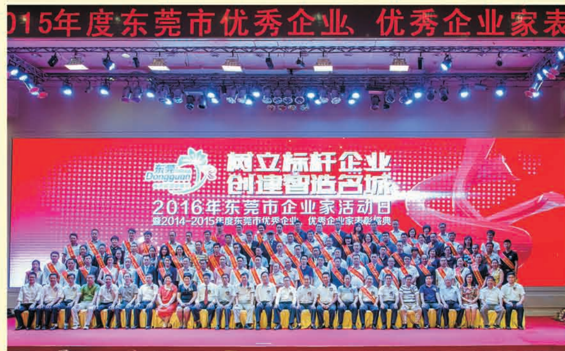
▼ 优秀企业、优秀企业家合影留念