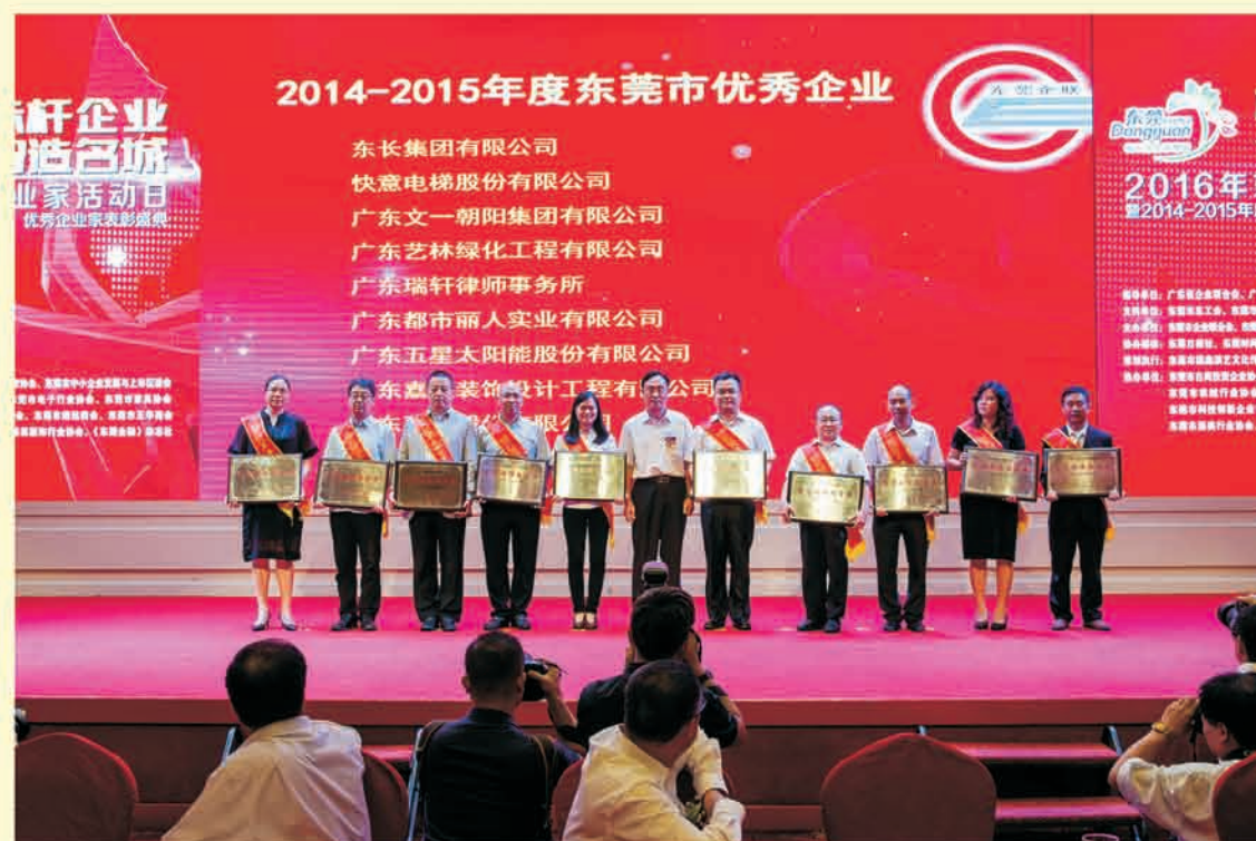
▲ 优秀企业表彰现场