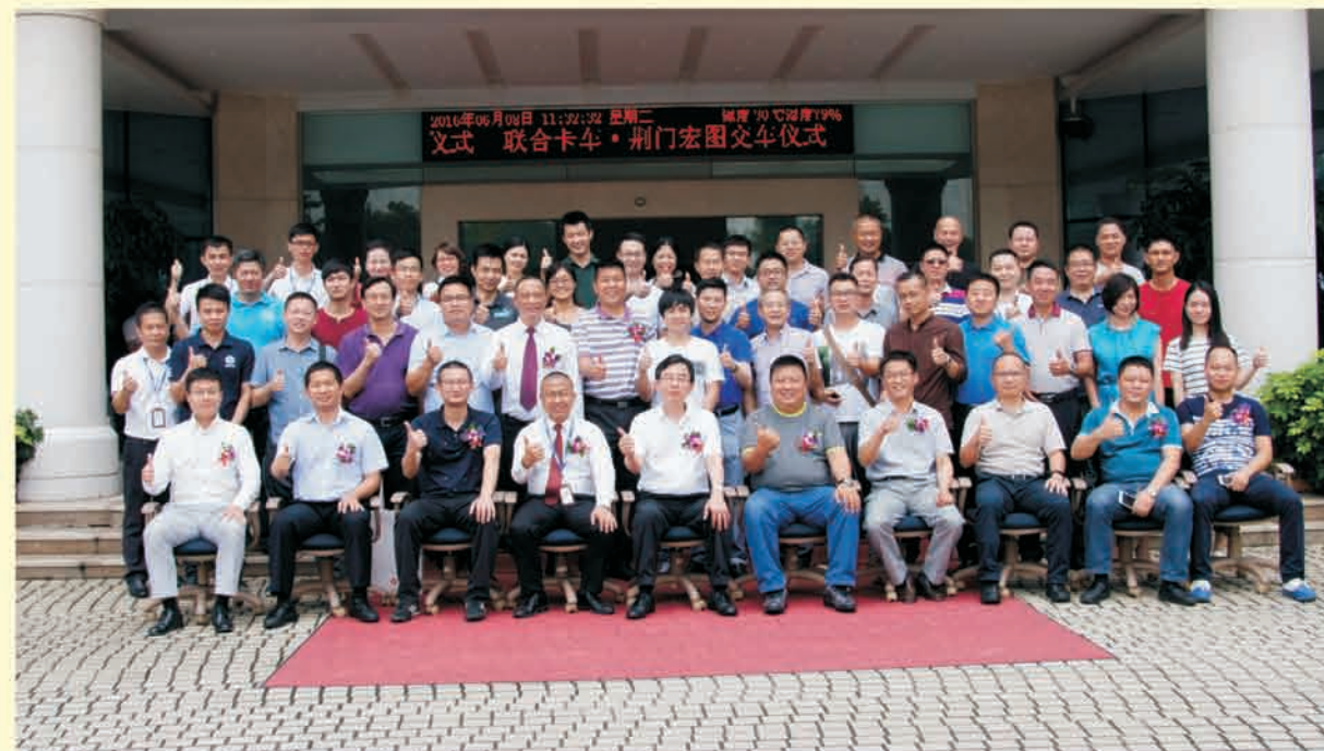
▼ 出席交车仪式的嘉宾合影留念

此次购买的20台新车，不但更进一步地满足了市场和客户的需求，同时也为公司未来的发展提供更坚实的基石。我们的物流团队始终秉承“以德为先、以诚为本”的服务理念，提供更优质的一站式物流运输服务，期待未来我们共同“联合大展宏图”！