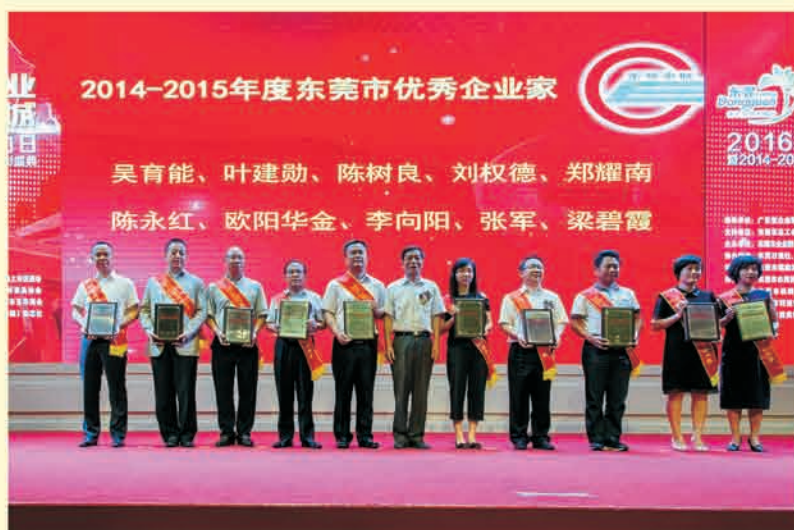
优秀企业家表彰现场 ▼

http://gzdaily.dayoo.com/html/2016-05/26/content_3203626.htm