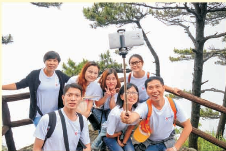
▲ 庐山景区部分人员合影