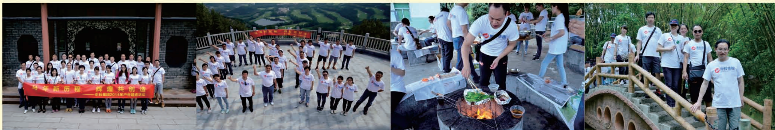
▲ 活动人员在可园景区合影留念