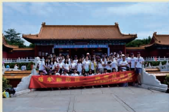
▲ 第二批旅游：圆明新园景区合影

珠海圆明新园、梦幻水城，活动当天首先游览了中国最大的皇家园林——圆明新园。圆明新园融古典皇家建筑群、江南古典园林建筑群和西洋建筑群为一体，为游客再显了清朝盛世风华。随后游玩的梦幻水城，给大家带来了惊险刺激的尖叫狂欢，徜徉在水的怀抱，感受一份夏日的凉意。