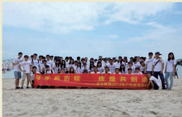
▲ 第一批旅游：巽寮湾沙滩合影

上午参观了具有岭南民俗文化的天后宫及出海体验渔民捕鱼的乐趣。下午的金色沙滩自由活动，不仅感受与海水的亲密接触和被海浪冲击的感觉；也可以与三五好友在凉亭下喃喃私语，分享共同的快乐。