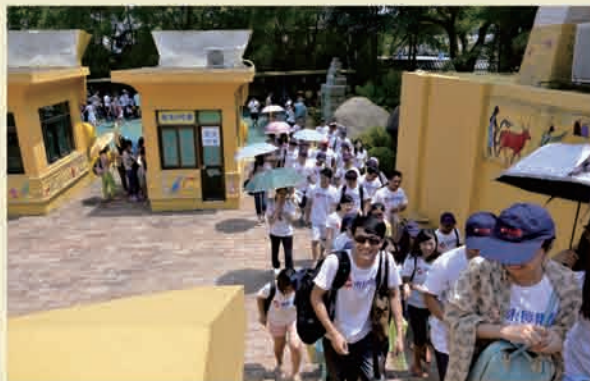
▲ 第二批旅游：活动人员带着快乐的心情前往梦幻水城

6月20日至22日，集团第三批旅游活动地点选择了湖南韶山、长沙，开启了为期三天的红色之旅，本次旅游所到的主要景区有：韶山毛泽东遗物馆、毛泽东纪念馆、毛泽东广场、毛主席故居，以及长沙靖港古镇、橘子洲头、主席青年时雕像、岳麓山、爱晚亭等风景名胜。在旅游中，大家在