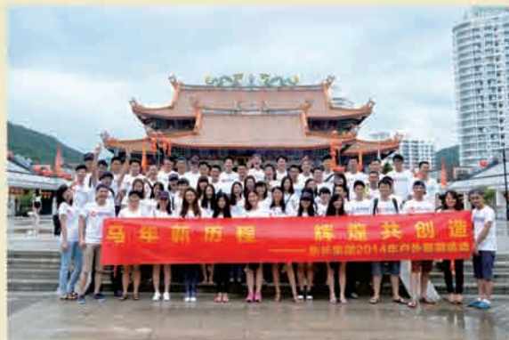
▲ 第一批旅游：惠东天后宫景区合影

员工是公司最大的资源和财富，是公司发展和前进的最根本力量，为活跃员工文化生活，创建和谐愉快的工作环境，集团于六月上中下旬组织全体员工分批进行了旅游活动。