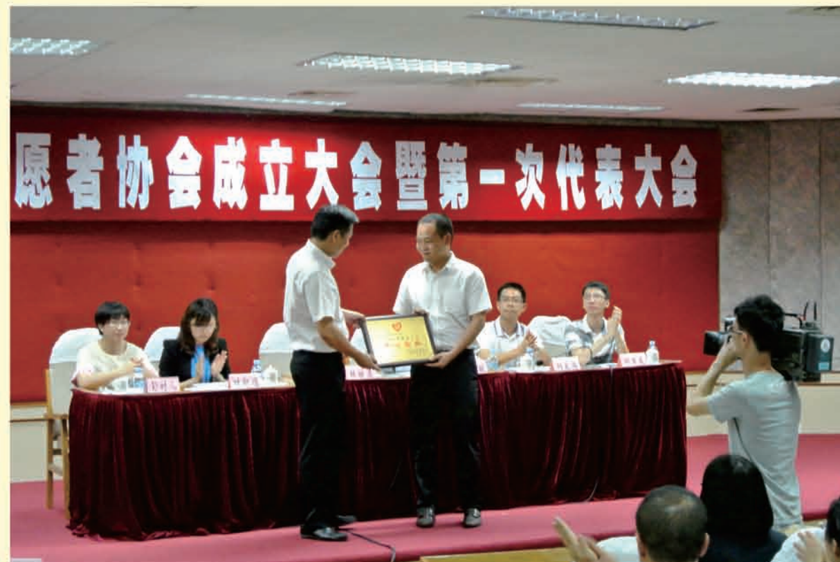
韩暖渠委员给我司颁发“热心企业”的牌匾 ▲