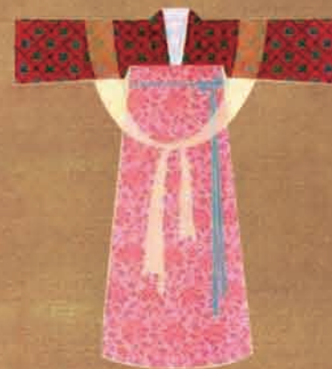
唐朝以石榴喻红裙