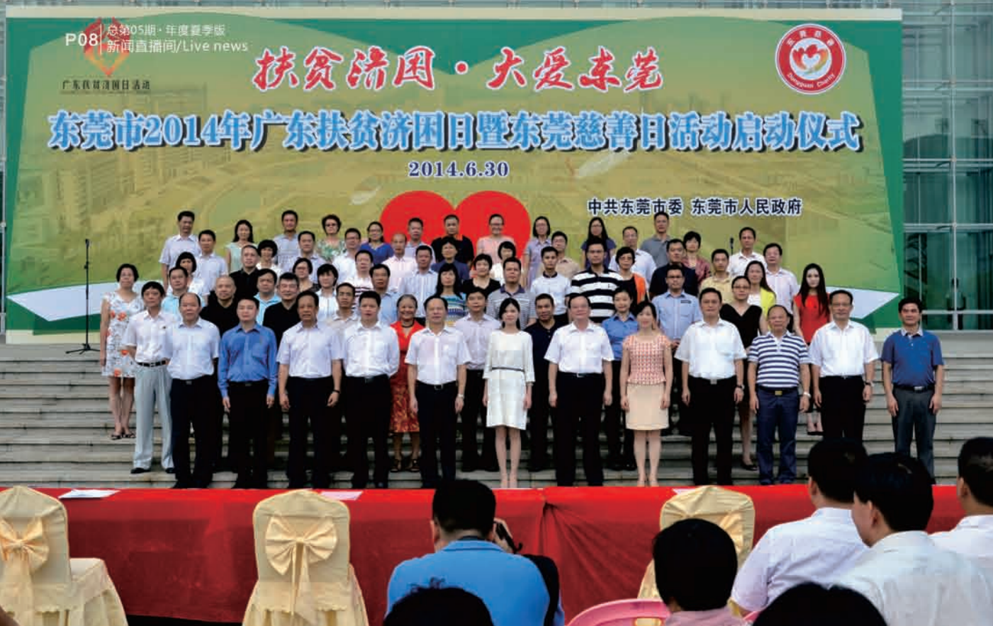
▲ 捐赠代表与市委市政府领导合影留念